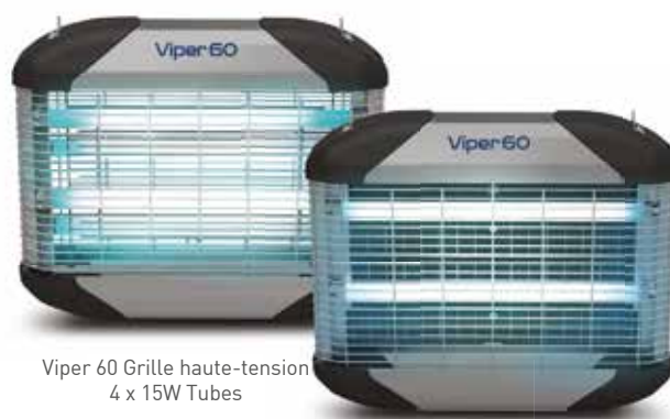
Viper 60 Grille haute-tension 4 x 15W Tubes