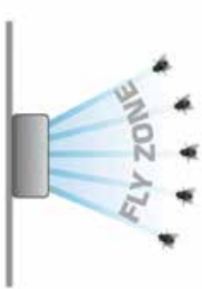
Appareil Opaque Attraction Limitée

Le Genus® Eclipse Ultra est une innovation unique et passionnante dans le domaine du contrôle des insectes volants en lieux publics. Il offre une rapidité de capture supérieure par rapport à la plupart des concurrents de sa catégorie, tout en proposant une coque avant personnalisable pensée pour les marques et les messages promotionnels.