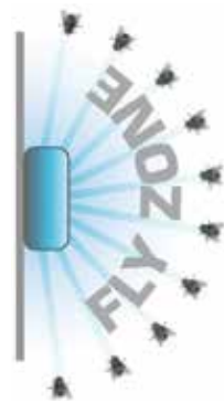
Appareil avec Translucent Technology™ Attraction Globale